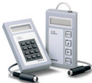
▲設定用リモートコンソール ユニット C110/C120